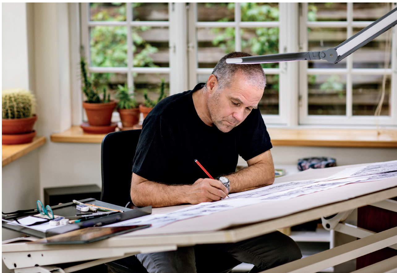
© Peter Madsen. Fotograf Simon Klein-Knudsen

Eventuelle modregnede beløb fordeles individuelt mellem billedskabere efter de almindelige nøgler for individuel fordeling i VISDA. For medlemsorganisationer, der modtager under 50.000 kr. årligt, gælder der en bagatelgrænse for hensættelser på op til 100.000 kr.