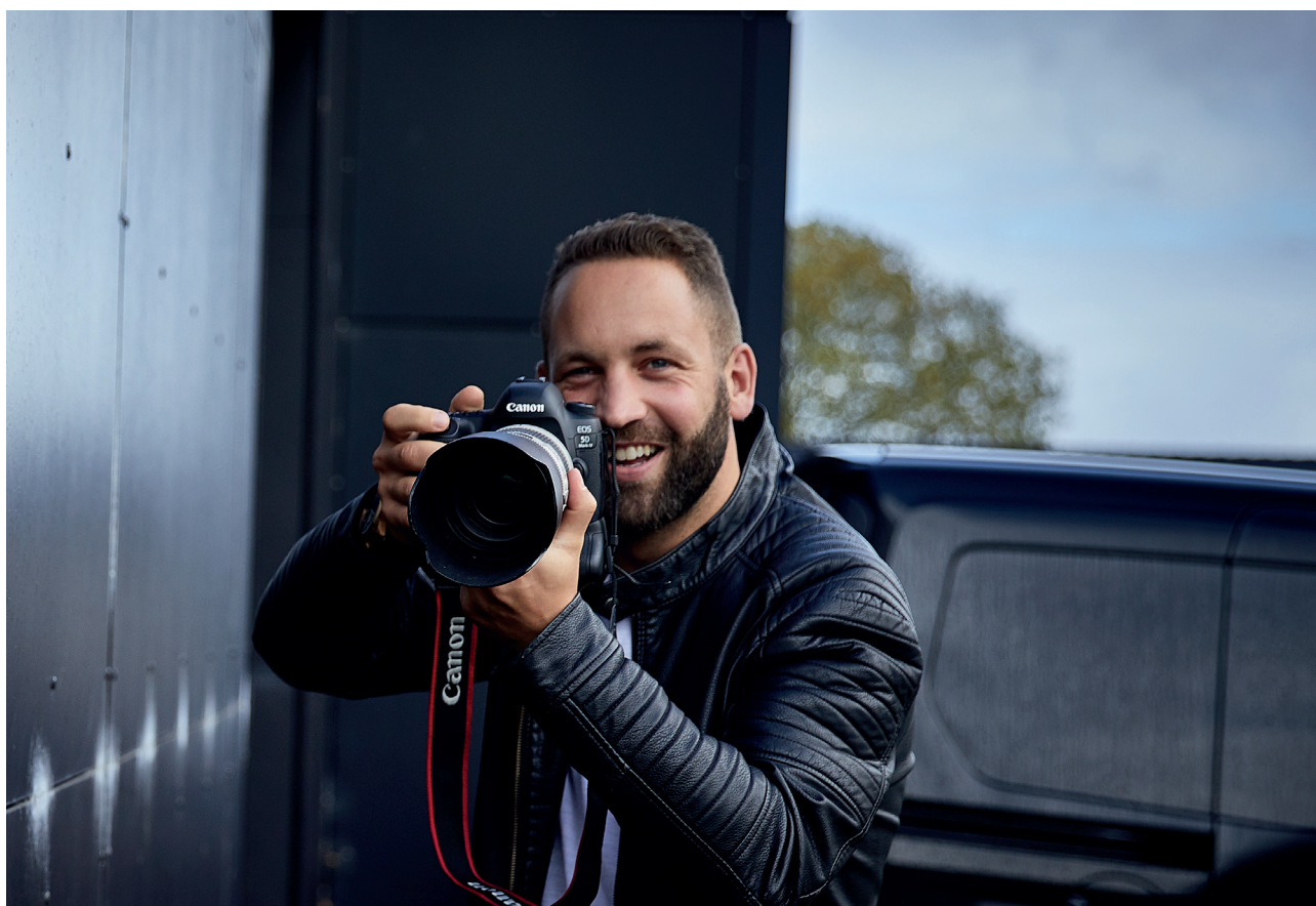
© Jacob Rosenvinge. Fotograf Martin Bendix